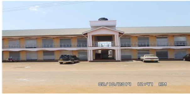
MBINGA BUS TERMINAL – H/WILAYA YA MBINGA - IMEKAMILIKA