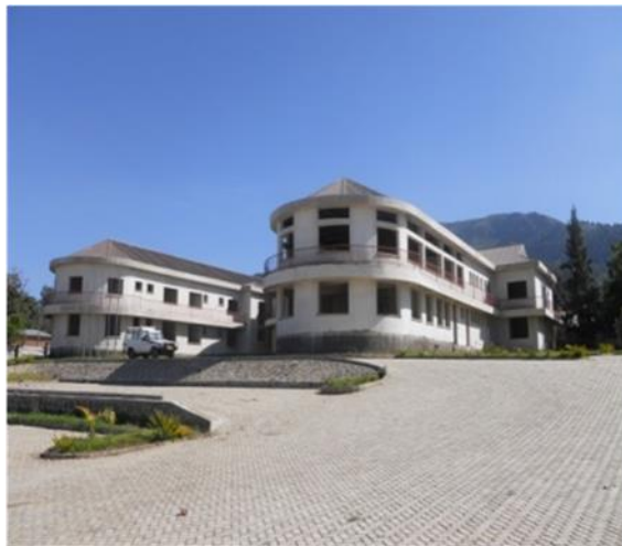
BENJAMIN MKAPA HOSTEL - MBEYA JIJI IPO HATUA ZA KUKAMILIKA