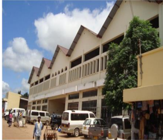
SOKO LA KIUSA - MOSHI MANISPAA LIMEKAMILIKA