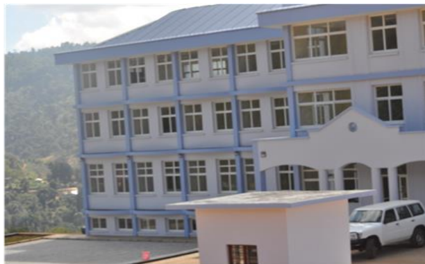
JENGO LA UTAWALA– H/WILAYA YA LUSHOTO - LIMEKAMILIKA